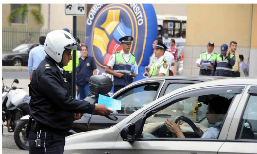
Ilustración 2. Agente de Tránsito Socializando temas de Prevención

Solo un minúsculo grupo de empresas y trabajadores han empleado las nuevas tecnologías, unos de los desafíos para las TIC en esta región de América es evitar que con su uso la heterogeneidad productiva y desigualdad social vaya en aumento. (Marta Novick, 2013)